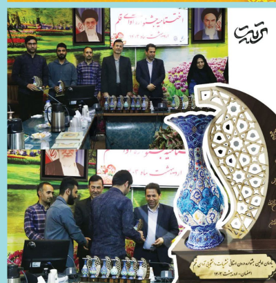
کسب رتبه اول نشریات فرهنگی اجتماعی توسط نشریه تربیت در جشنواره آوای قلم

به گزارش کانون نویسنده فاطمه الزهرا (س) انجمن علمی آموزش ابتدایی مرکز آموزش عالی شهید دکتر آیت نجف آباد، وبینار هوش مصنوعی و کاربرد آن در تولید محتوا و نگارش، روز شنبه ۱۳ بهمن ماه ۱۴۳۲ در ساعت ۱۸:۰۰ در کانال تلگرامی مرکز برگزار شد.