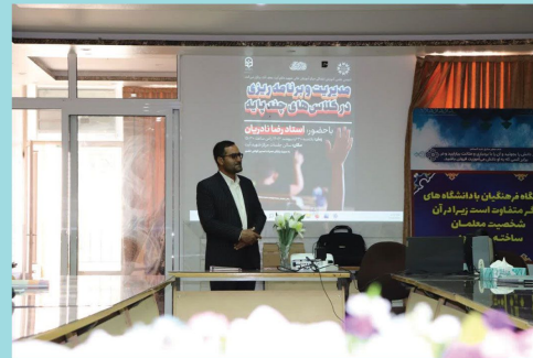
کارگاه مدیریت و برنامه ریزی در کلاس های چندپایه

اخبار انجمن علمی آموزش ابتدایی مرکز آموزش عالی شهید دکتر آیت نجف آباد